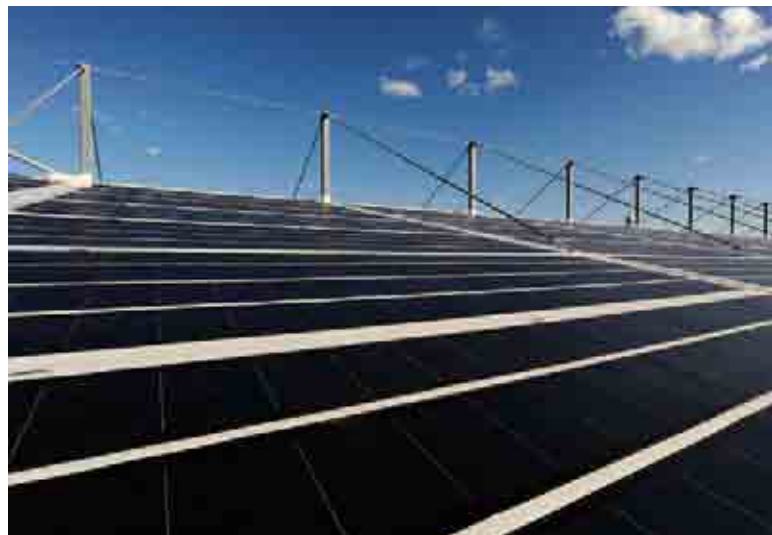
Sportanlage Gründenmoos 2008, grösstes Folien-Solkraftwerk der Schweiz, Leistung: 57 kWp, Schweizer Solarpreis 2009