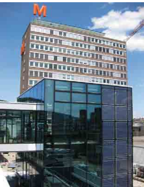
Migros Herderen, Zürich 2009, Doppelnutzung der Solarzellen in Isolierglas als Beschattungselement, Leistung: 38 kWp