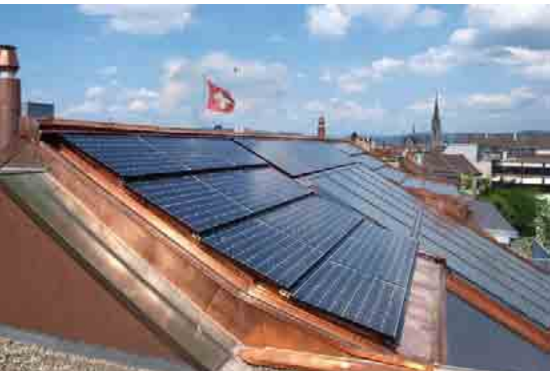
Mehrfamilienhaus Feldbergstrasse, Basel 2009, Doppelnutzung Solarmodule als Dacheindeckung, Leistung: 7 kWp, Schweizer Solarpreis 2009